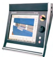
Delem DA-66T 3D Windows