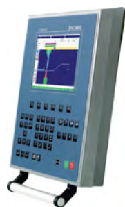
Cybelec DNC 880 2D Windows