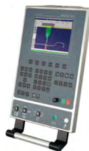
ModEva 10 2D Windows