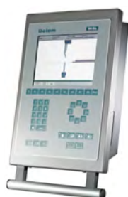
Delem DA-56 2D Windows