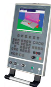
ModEva 12 3D Windows