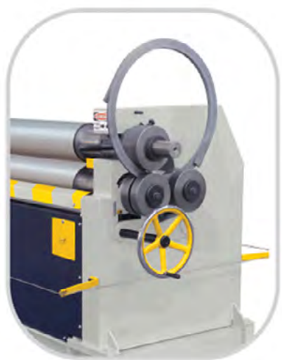
Mulighed for valsning af profiler

MRM-S rundemaskinerne er motoriserede maskiner med asymmetrisk valseplacering som muliggør forbukning af emnet. Ideel for pladeemner op til 10 mm. Alle valser er bomberede for at sikre præcise og lige svøb. Standard med motoriseret forbukning med bagvalsen og konusvalsning. Mulighed for konisk valsning. Over og undervalse er begge drevne. Manuel klappleje. Betjening via mobil kontrol panel. Leveres med komplet sikkerhedsudrustning i henhold til de nyeste CE-direktiver. Kan som ekstra udstyr leveres med hærdede valser, digital udlæsning og motoriseret justering af undervalsen. Også mulighed for forlængede valser.