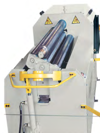
Hydraulisk betjent topvalse

4R HMS rundemaskinerne er hydrauliske 4-valsede maskiner med forbuk og konusvalsning. Ideel for pladeemner op til 10 mm pladetykkelse. Mulighed for konisk valsning. Justering af valser med individuelle lineære hydrauliske cylindre. Overbelastningsbeskyttelse. Transmission via hydraulikmotor og planet gear. Mulighed for både cirkulære og varierede radius valsninger. Betjening via mobil kontrolpanel. Hydraulisk klapleje. 3-akset digital udlæsning er standard. Induktionshærdede valser. Leveres med komplet sikkerhedsudrustning ifølge de nyeste CE-direktiver.