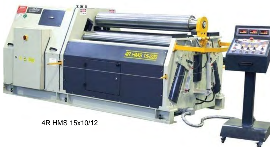
4R HMS 15x10/12