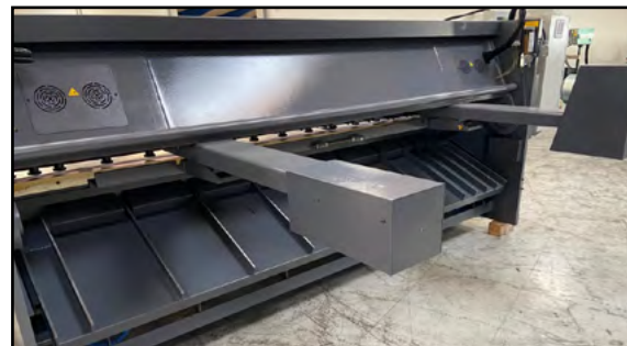
Pneumatisk pladefang type Universal