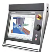
Delem DA-69T 3D Windows