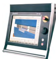
Delem DA-66T 3D Windows