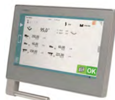
Cybelec VisiTouch 19