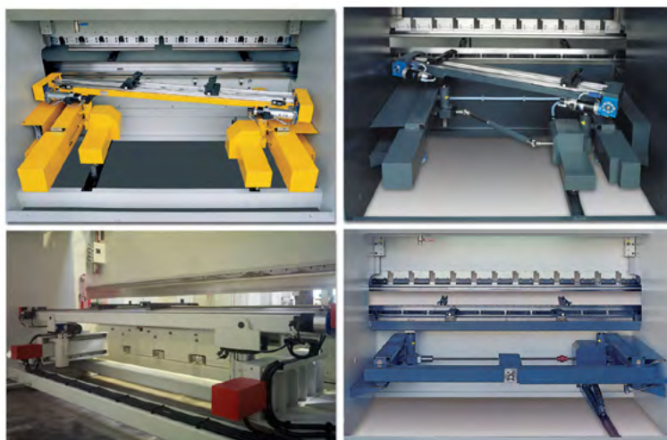
Systemer af pladeanslag