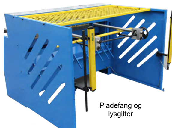
Pladefang og lysgitter

Pladesakse type SMP er robuste og solide maskiner i en hensvejset og enkel konstruktion. Et simpelt og unikt træksystem med direkte kædeoverførsel af trækraften til hovedakslen. Høj klippehastighed og meget støjsvag i drift. Optimeret klippevinkel medfører en minimal deformering af det afklippede emne. Højkvalitetsknive og gummibelagt pladetilholder er standard. Der er anvendt smøre- og vedligeholdelsesfri lejer og kulisseføringer.