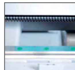
Fødesnegl i alle automatiske NC båndsave