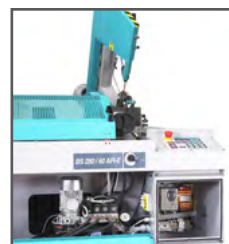
Hydr. enhed og el-panel