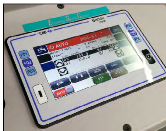
Tastatur til CNC automatisk båndsav