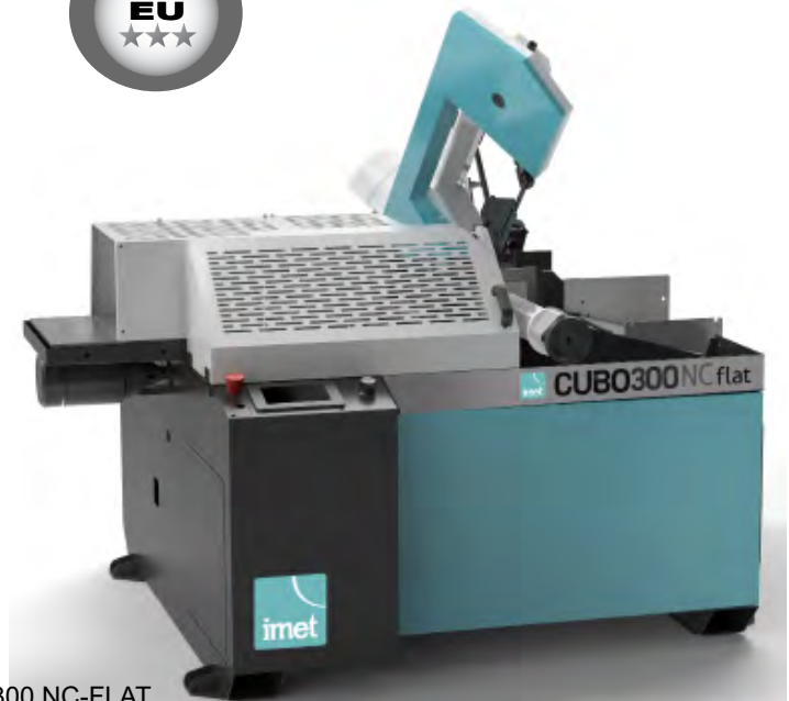
CUBO 300 NC-FLAT

Fulldautomatiske båndsave med smigskæring fra 0° til 60° til venstre. CUBO 300 modellerne skærer 0° til 45° i automatisk cyklus og 0° til 60° i semi-automatisk cyklus. Støbejerns savbue med rørformet sektion med elektronisk vekselretter for variabel klingehastighed.