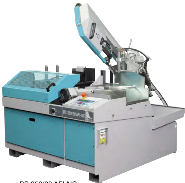
BS 350/60 AFI-NC