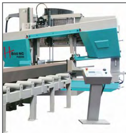
Rulleborde, fås også motoriseret og i vertikal version