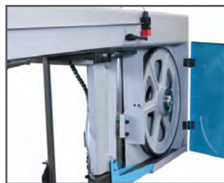
Båndhjul H 601