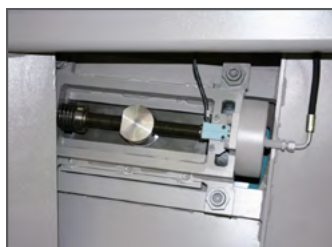
Klingespænding via elektro-mekanisk system, CNC-styret