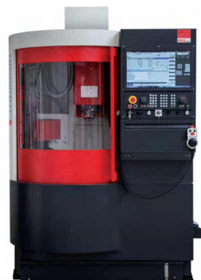
CONCEPT MILL 260

CONCEPT MILL CNC fræsemaskiner er fleksible maskiner, ideelle til mindre virksomheder eller til CNC-undervisningsformål. Takket være det modulære design kan det tilsluttes et CIM-netværk og udstyres med træningssoftware og courseware. Fræsemaskinerne har en bred vifte af automatiseringsmuligheder.