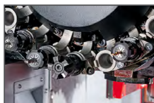
20-station CM 260