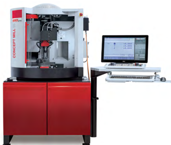
CONCEPT MILL 55