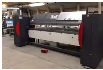
HMT kantbukkemaskine Type Maxi 30/40 SH, DEMO Årg. 2016, kap. 3020 x 4 mm