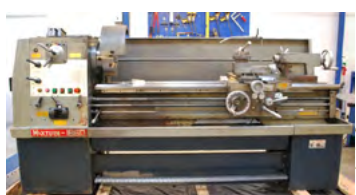
Maxturn drejebænk Type PHL-1860, årg. 1990 centrerpatron, endestop