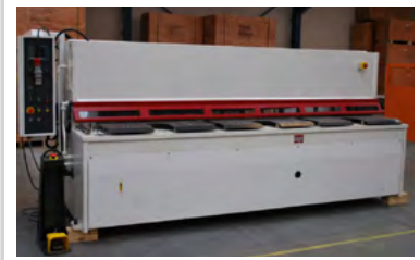
Baykal hydr. maskinsaks Type HGL 3106, årg. 2016 3060 x 6 mm, Cybtouch 6