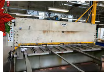
Nymi maskinsaks 3100 x 6 mm, digital bagstop oplæggerarme