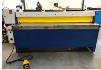
Kapema maskinsaks Type SMP 20/20, DEMO pneum. pladefang, motoranslag