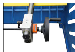
Man. pladeanslag med tæller