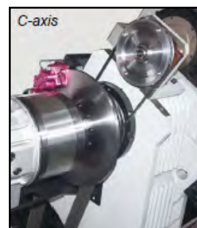
C-akse med bremsesystem muliggør spindelindeksering & giver overlegen ydeevne