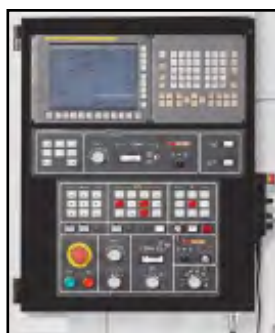
Fanuc 0iTF styring med 10,4" LCD display og Manual Guide i