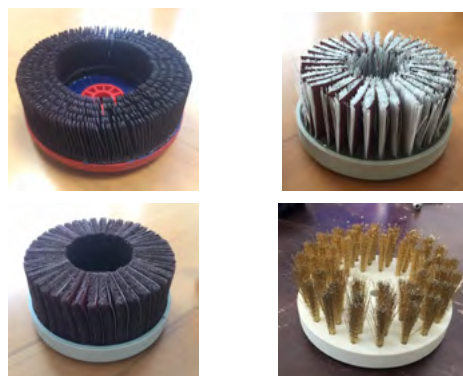
Tangentialbørster med hurtigskift-anordning