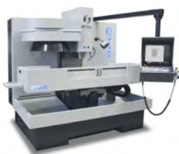
BT1500 / BT1500E