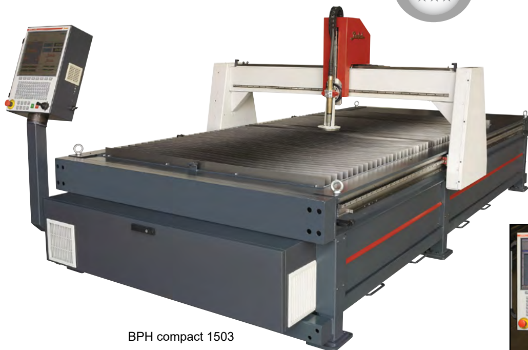
BPH compact 1503