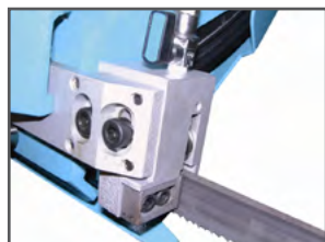
Savklingeføringer af hårdmetal