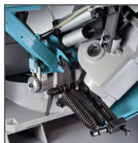
Fjedre til perfekt balance på savbuen