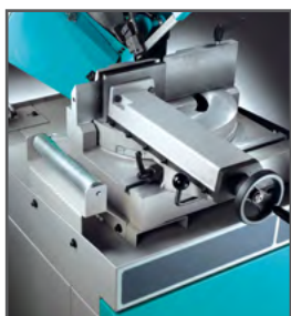
Skruestik med hurtig tilspænding