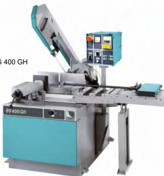
BS 400 GH