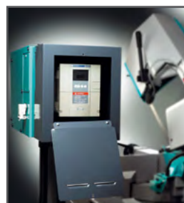
BS 300 ensretter