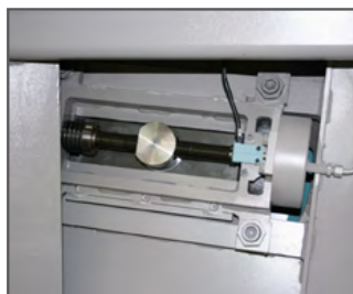
Klingspænding KTECH via elektro-mekanisk system, CNC-styret