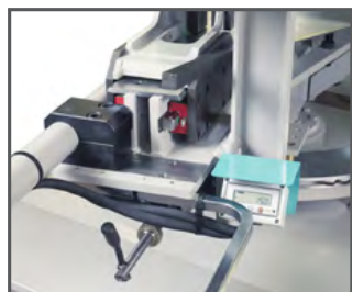
Digital display som viser savbue-vinkel