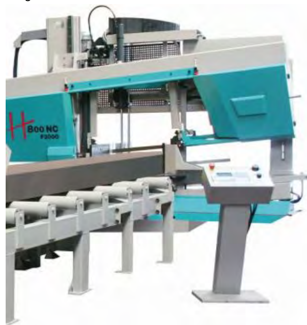
KS 802 NC med rullebord - forskellige rulleborde tilgængelige, også motoriseret og i vertikal version